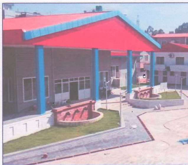
तस्विर: निर्माणाधीन "प्रदेश सभा हल", हेटौडा मकवानपुर