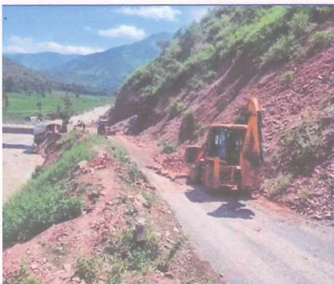
तस्विर: पहिरो हटाई आवागमन सुचारू गर्दै, रामेछाप