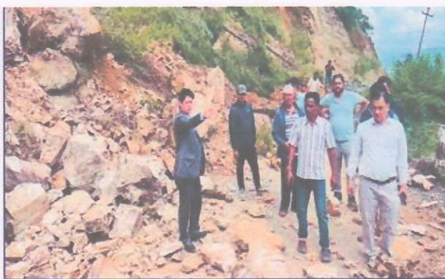
विपदमा जनता संग ( आवागमन सुलाउन प्रयासरत)