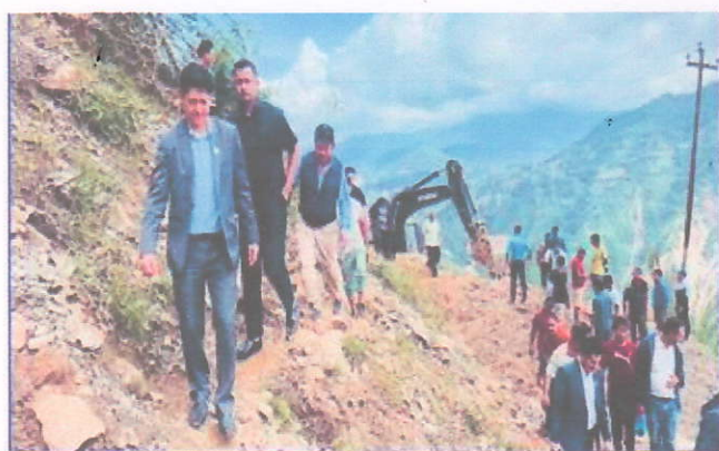
तस्विर: विपदमा जनता संग (आवागमन सुलाउन प्रयासरत)