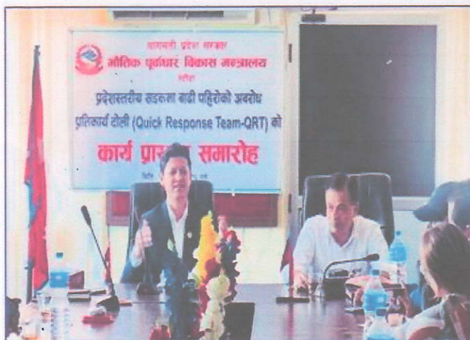
तस्विर : द्रुत प्रतिकार्य टोली (QRT) गठन समारोह